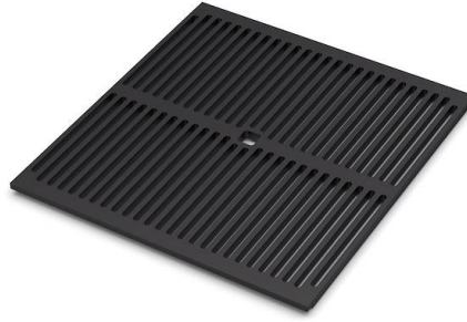
Copy 8100 617