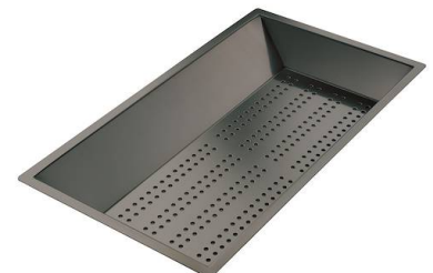
Bandeja perforada inox PVD Gun Metal 8151 006