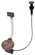
Desagüe automático Space Push Copper