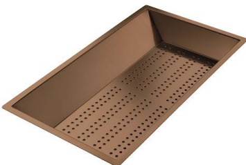
Bandeja perforada inox PVD Copper 8151 008